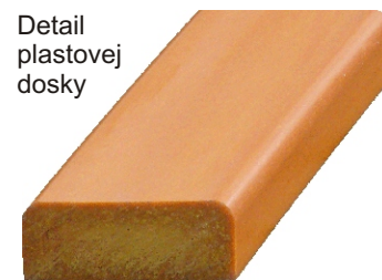
Detail plastovej dosky