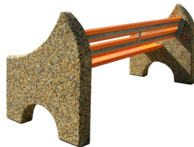
Axonometria - zadný pohľad