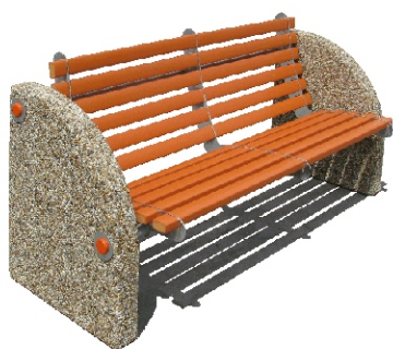
Axonometria z ľava

K betónovým dielom je možné priskrutkovať roznášacie základové pätky pod zámkovú dlažbu, alebo oceľové pripevňovacie plechy, pomocou ktorých sa dá lavička priskrutkovať k podkladu