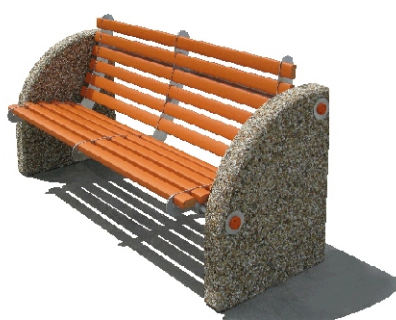
Axonometria z prava